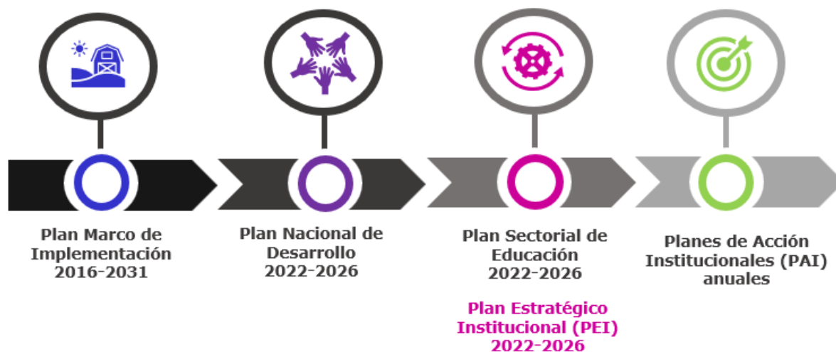
Gráfica 3. Instrumentos de planeación