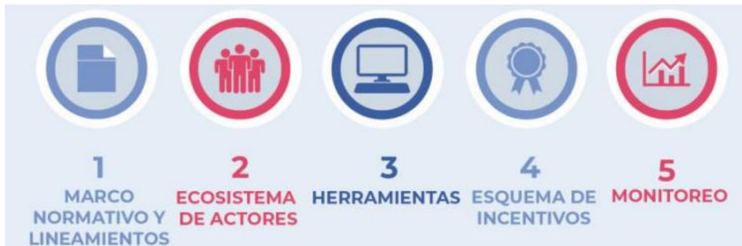
Ilustración 2 Marco de Gobernanza de la Iniciativa de Datos Abiertos.

marco técnico que brinda la política de Gobierno Digital y su relación directa con acciones estratégicas de mejoramiento interno y sectorial. Es así como el nuevo enfoque de la política permite el fortalecimiento de los lazos de confianza entre el estado y el ciudadano, favoreciendo la liberación de datos, un mejor acceso a los mismos, mayor intercambio, y finalmente su reutilización e impacto. En Colombia este marco de Gobernanza se compone de 5 elementos clave: