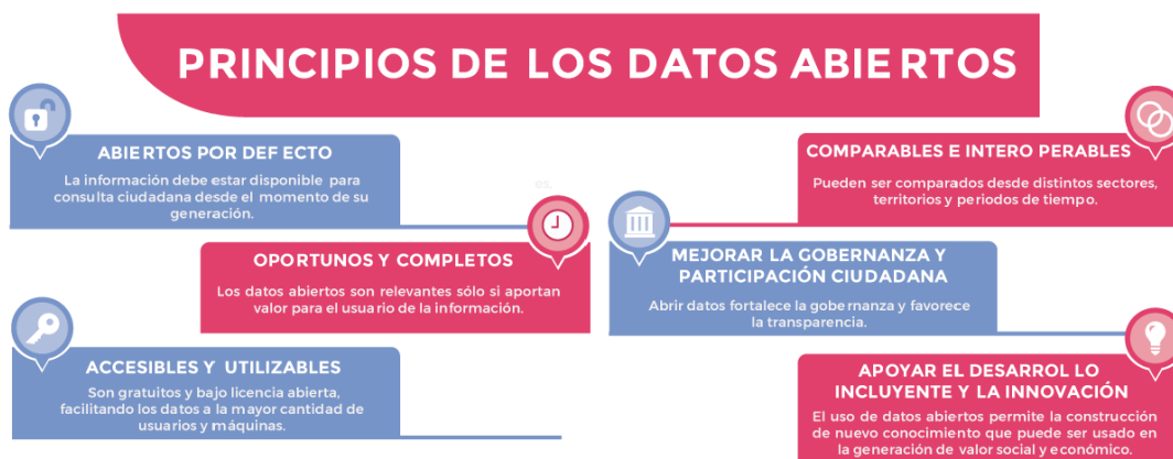
Ilustración 1 Principios de los datos abiertos

Los seis principios de la Carta Internacional de Datos Abiertos fueron desarrollados en 2015 por gobiernos, la sociedad civil y expertos de todo el mundo como un conjunto de normas acordadas a nivel mundial sobre cómo publicar datos. Además de las características básicas de los datos abiertos, los principios actuales que promueve la Carta son: