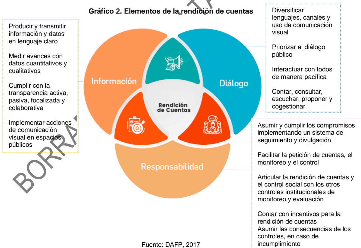
Gráfico 2. Elementos de la rendición de cuentas

Responsabilidad: Responder por los resultados de la gestión, definiendo o asumiendo mecanismos de corrección o mejora en sus planes institucionales para atender los compromisos y evaluaciones identificadas en los espacios de diálogo. También incluye la capacidad de las autoridades para responder al control de la ciudadanía, los medios de comunicación, la sociedad civil y los órganos de control, con el cumplimiento de obligaciones o de sanciones, si la gestión no es satisfactoria. 4