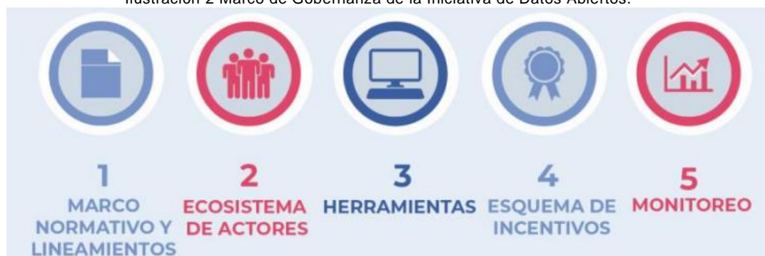
Ilustración 2 Marco de Gobernanza de la Iniciativa de Datos Abiertos.

confianza entre el estado y el ciudadano, favoreciendo la liberación de datos, un mejor acceso a los mismos, mayor intercambio, y finalmente su reutilización e impacto. En Colombia este marco de Gobernanza se compone de 5 elementos clave: