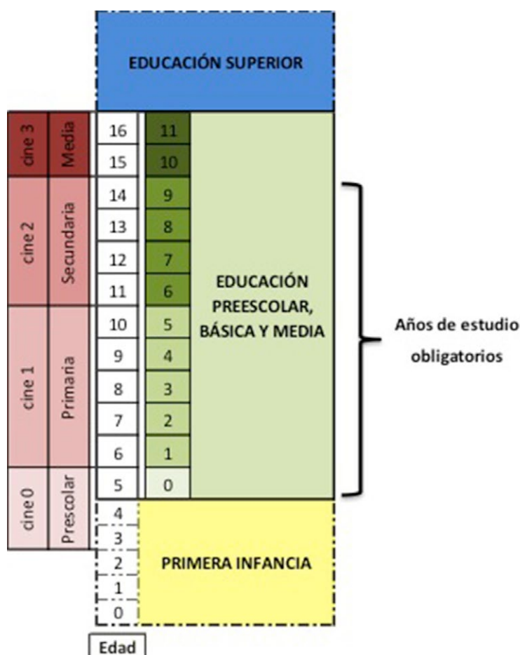
—• Figura 1. Sistema Educativo Colombiano •—

A continuación se presenta el esquema de organización del Sistema Educativo Colombiano, acorde con la Clasificación Internacional Normalizada de la Educación (CINE), aprobada por la Conferencia General de la UNESCO.