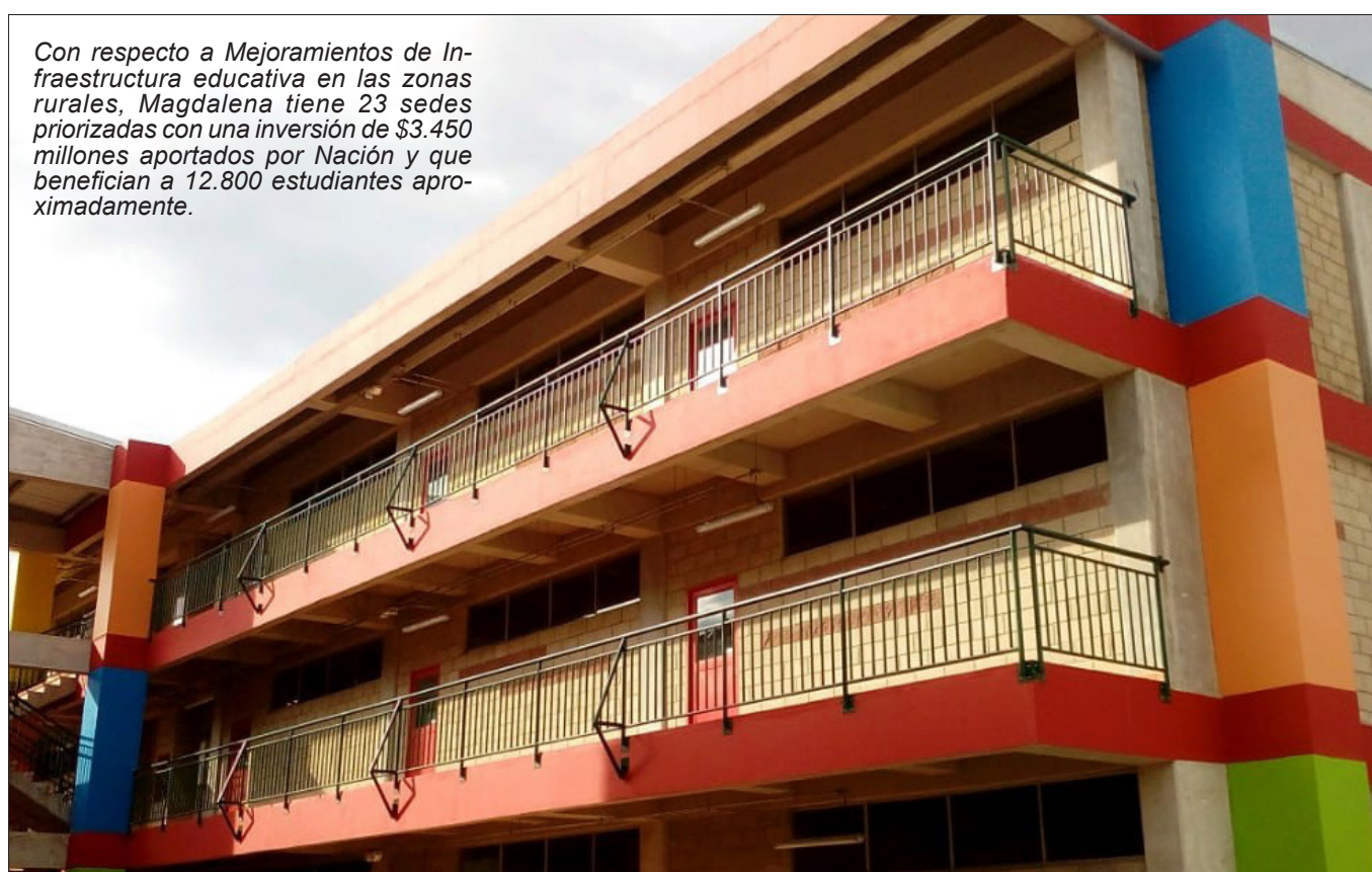
Con respecto a Mejoramientos de Infraestructura educativa en las zonas rurales, Magdalena tiene 23 sedes priorizadas con una inversión de $3.450 millones aportados por Nación y que benefician a 12.800 estudiantes aproximadamente.

En el Magdalena, el total de la inversión proyectada con respecto a los 11 proyectos que se están ejecutando es de $60.574 millones, para beneficiar a 10.105 estudiantes.