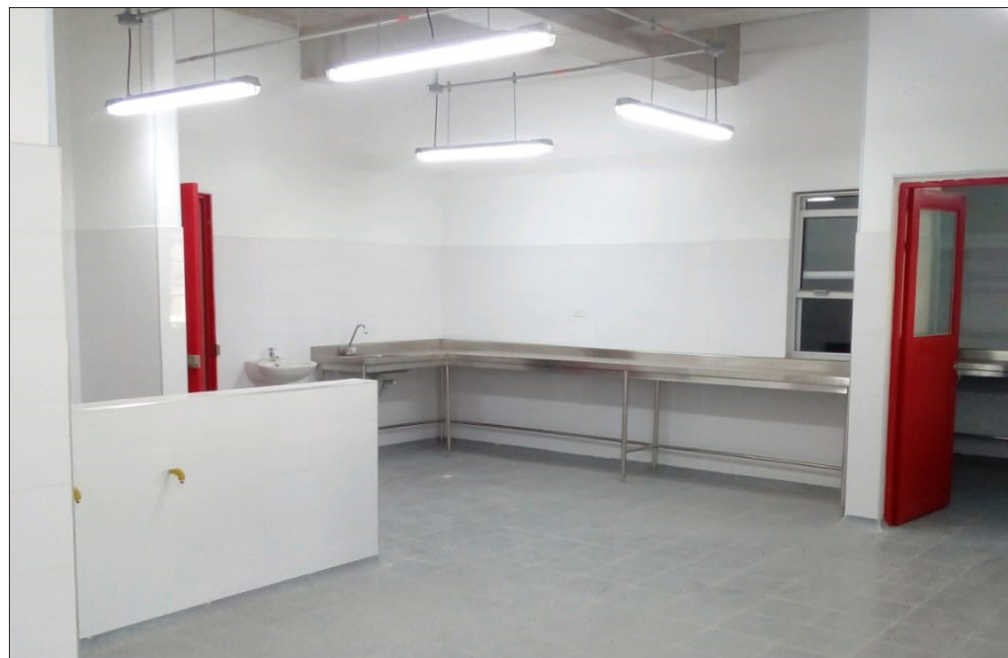
El total de la inversión proyectada es de $60.574 millones, en el Magdalena, para beneficiar a 10.105 estudiantes.

nuevas, especializadas y mejoradas. El total de la inversión proyectada