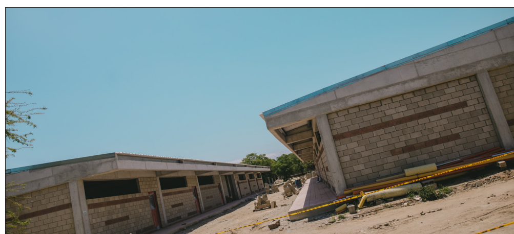
En Magdalena, 14 sedes están en etapa de ejecución de obra y dos ya fueron entregadas. En la foto: IE Nuevo Amanecer con Dios.

Adicionalmente, se tuvo en cuenta la inversión histórica de recursos realizada por el Ministerio en los municipios, el desempeño fiscal, las sedes educativas en municipios de frontera y municipios Bicentenario; las sedes que funcionan o tienen implementa-