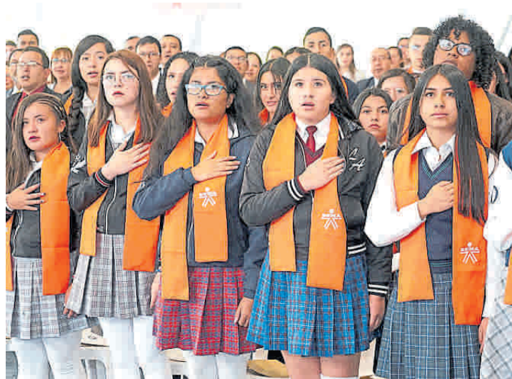
Esta es una imagen de los primeros estudiantes bachilleres que obtienen la doble titulación. Se espera que al final de este cuatrienio sean 650.000, según datos del Ministerio de Educación Nacional y el Sena.

Hoy en el país 143.000 bachilleres recién graduados tiene doble título: el de bachiller y el de técnico y se espera que para finales del 2020 esta cifra llegue a los 650.000, según datos del Ministerio de Educación Nacional y el Sena.