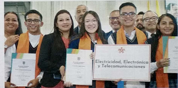
Los programas de formación incluyen sectores como salud, comercio, hotelería y turismo, textiles, entre otros.

meses lleva esta iniciativa del Ministerio, en alianza con el Sena, para ofrecer a los jóvenes un certificado técnico, además de su diploma de bachiller, que les reconozca unas competencias generales y específicas.