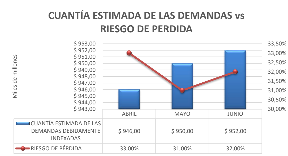
Grafico 2. Cuantía estimada de las demandas Vs Riesgo de pérdida.

El riesgo de pérdida tiene un comportamiento variado al estar en el mes de abril en un 33%, en el mes de mayo en un 31% y en el mes de junio en un 32% de probabilidad de pérdida. Por último, los comportamientos de la cuantía estimada de los casos tienen unos leves crecimientos esto dado que se están indexando cada uno de los casos mes a mes.