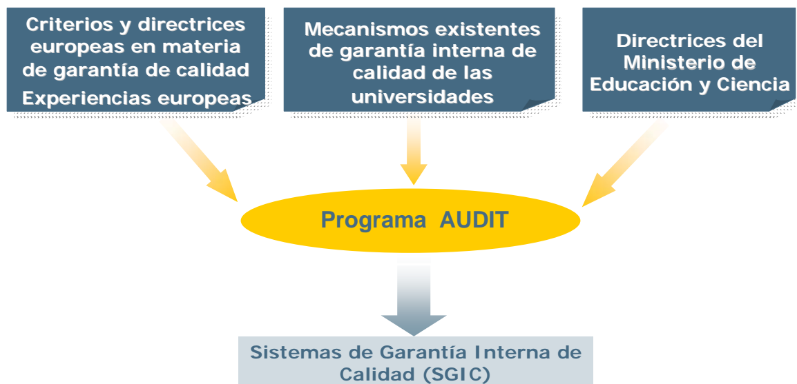
Figura 3: Elementos que interactúan en el programa AUDIT

Como se recoge en la Figura 3, en la elaboración del programa AUDIT se han tomado en consideración los sistemas de garantía de calidad presentes en la actualidad en las universidades españolas, derivados en buena medida de los programas de evaluación orientados a la mejora, realizados en la última década, así como las directrices del Ministerio de Educación y Ciencia, los criterios y directrices europeas en materia de garantía de calidad y las experiencias de las universidades europeas en este ámbito.