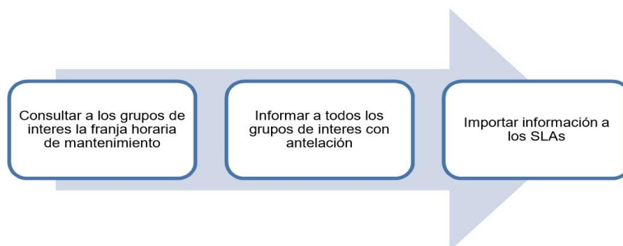
Gráfica 1. Procesos de planeación de mantenimiento.