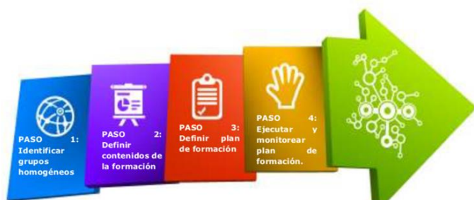
Ilustración 1. Pasos para estructurar el esquema de formación