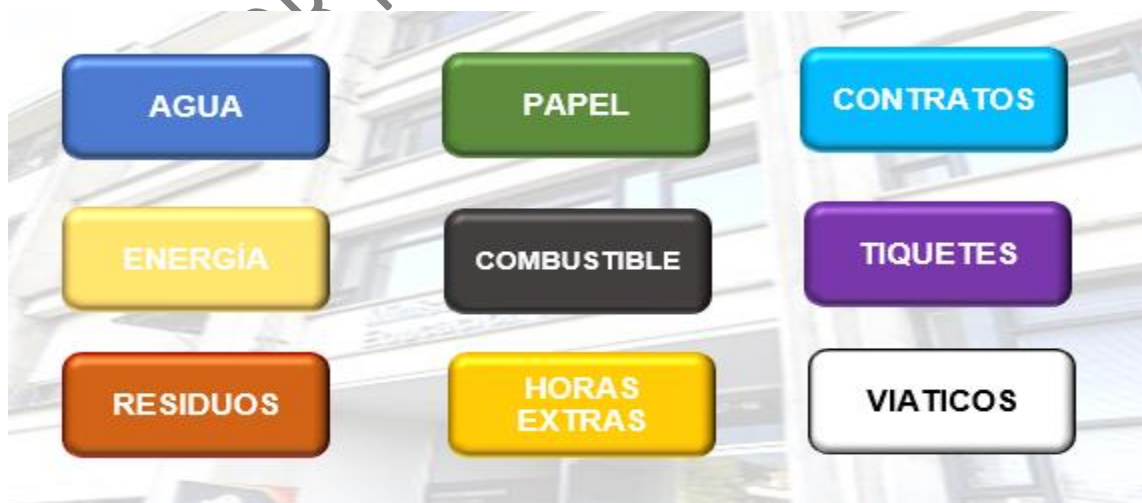
Figura 1: Conceptos de gasto Plan de Austeridad