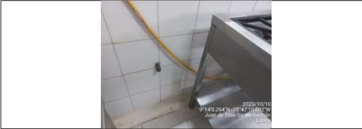
Fotografía 5: Estufa sin conexión a gas.