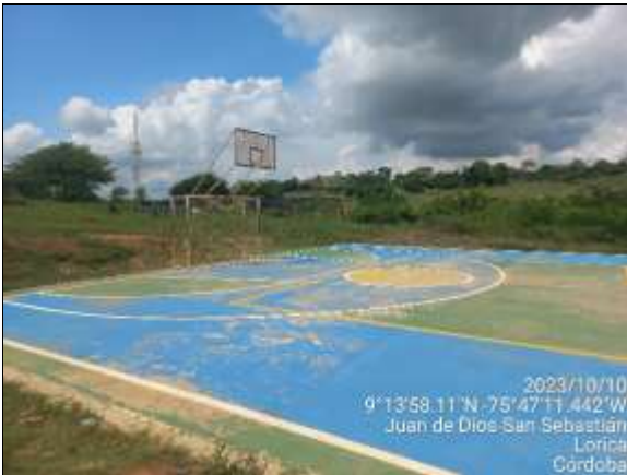
Fotografía 6: Cancha multifuncional.