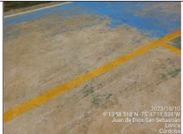
Fotografía 7: Cancha multifuncional con fisuras.