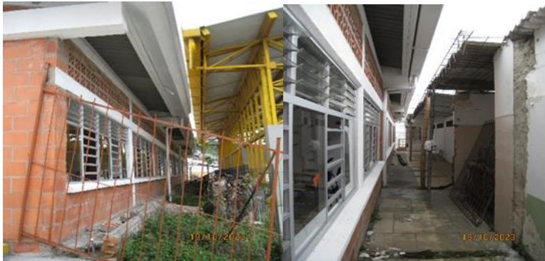
Soporte de canal reventado

obras complementarias, hay un soporte de la canal de aguas lluvias reventado, lo que produce que la canal no tenga un adecuado soporte y confinamiento, ocasionando un inadecuado funcionamiento en este sitio; además, se tiene que en la parte posterior del bloque de 3 aulas adyacente al teatro, durante su construcción se recortaron unas vigas existentes de concreto, del teatro y se dejaron 2 cerchas provisionalmente instaladas con un taco de madera y otro metálico, para soportar las tejas de eternit antiguas, situación a subsanar o mejorar con prontitud para evitar el riesgo de caída de estos elementos que podrían ocasionar un accidente, como se muestra a continuación: