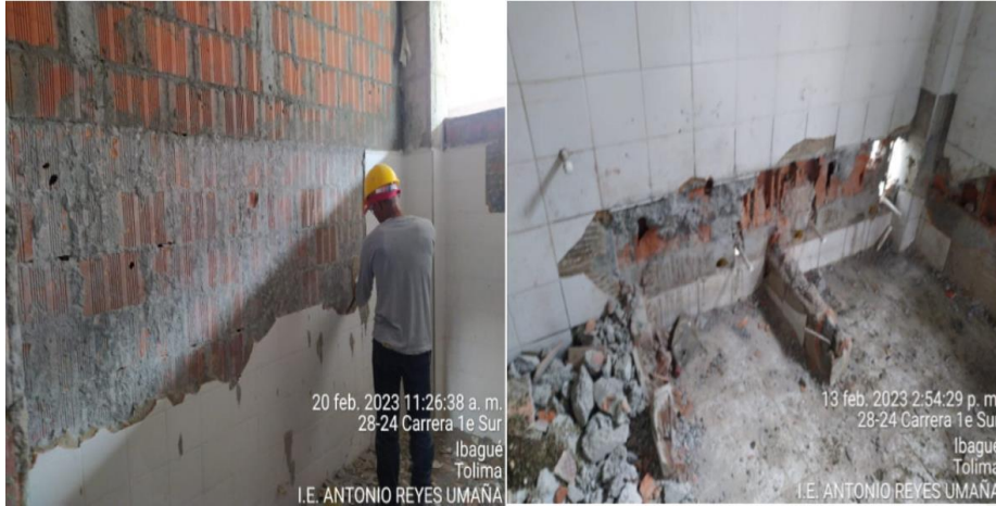
Imagen No. 1 Demolición de enchapes cerámicos (INC. retiro de sobr.), demolición muros en bloque; E = 12 cm (inc. retiro de sobr.)

1517-2022 sus suscrito entre el FFIE y CONSORCIO M&E CANAAN, porque las obras a demoler corresponden a obra entregada por GMP INGENIEROS S.A.S en ejecución de este mismo proyecto en el Acuerdo de obra No. 407005, recibidas y pagadas por el FFIE, las cuales fueron objeto del diagnóstico inicial presentado por CANAAN, señalando su mal estado y no cumplimiento de normas técnicas y por ende se incluyeron para su demolición y nueva construcción.