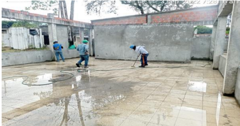
Imagen No. 3 Limpieza y aseo para reinicio de obra.