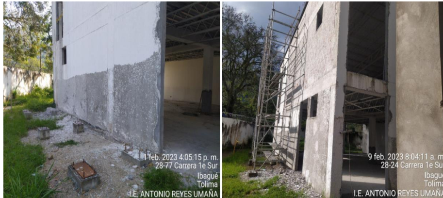
Imagen No. 2 Demolición pañetes (inc. Retiro de sobr.)