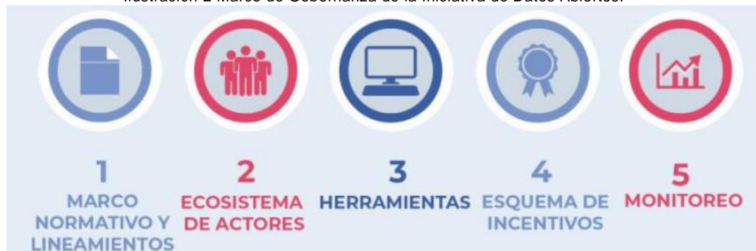
Ilustración 2 Marco de Gobernanza de la Iniciativa de Datos Abiertos.

confianza entre el estado y el ciudadano, favoreciendo la liberación de datos, un mejor acceso a los mismos, mayor intercambio, y finalmente su reutilización e impacto. En Colombia este marco de Gobernanza se compone de 5 elementos clave: