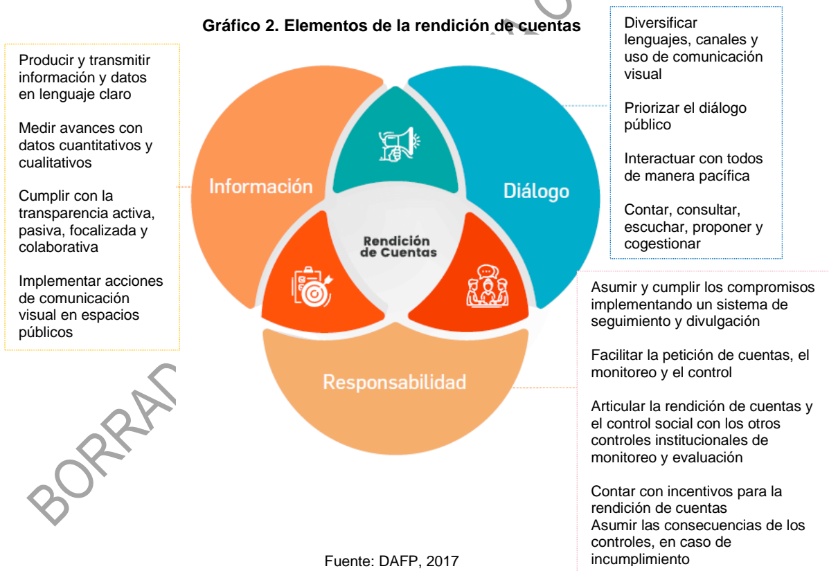
Gráfico 2. Elementos de la rendición de cuentas

La rendición de cuentas se convierte en una oportunidad para que la sociedad evidencie los resultados de la entidad de acuerdo con el cumplimiento de la misión o propósito fundamental, además, de la entrega efectiva de bienes y servicios