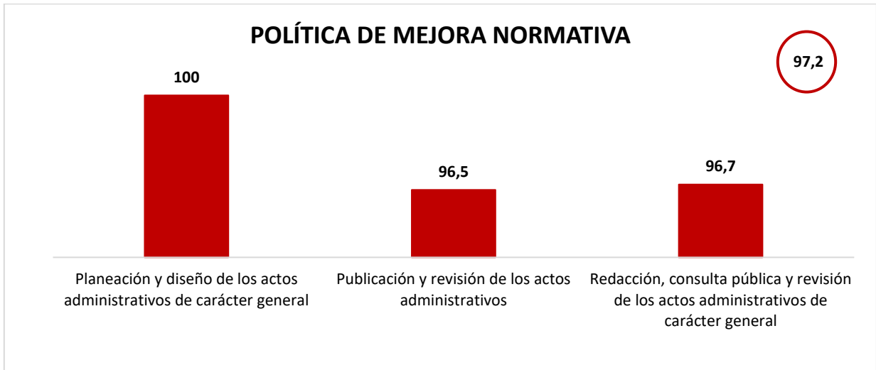
Gráfica 2: Resultados obtenidos de la Política de Mejora Normativa.

A continuación, se presentan los resultados de la vigencia 2022: