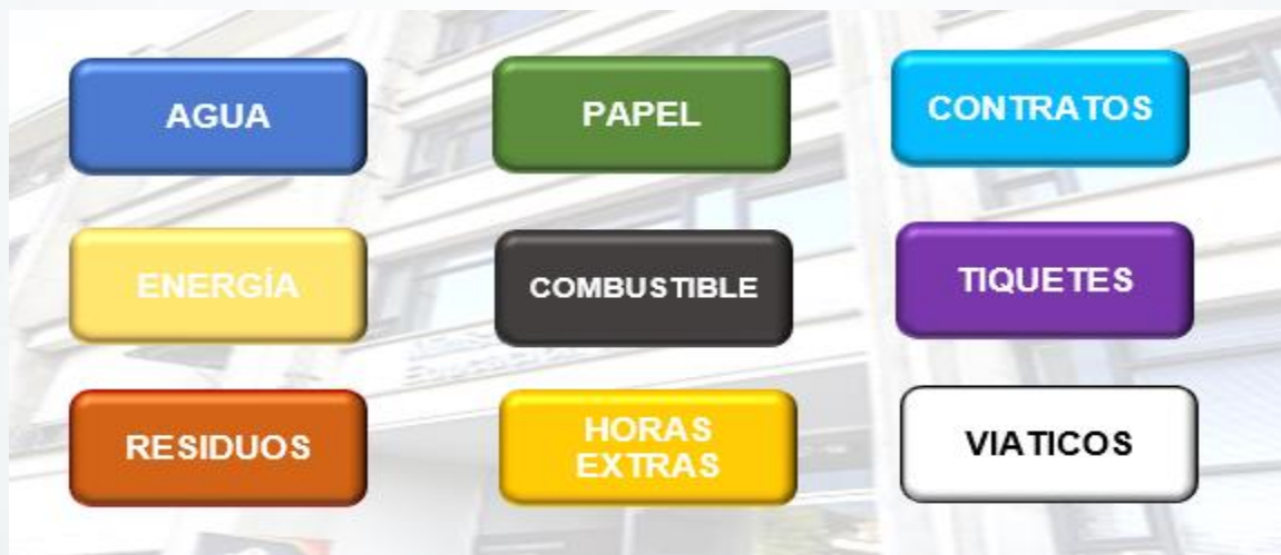
Figura 1: Conceptos de gasto Plan de Austeridad