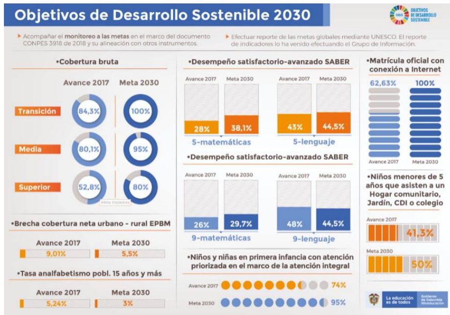
Ilustración 3 Objetivos de Desarrollo Sostenible con impacto en el sector educación MEN. (2018).