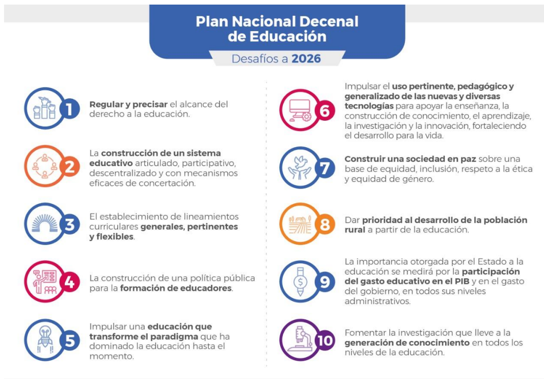
Ilustración 4. Desafíos Plan Nacional Decenal de Educación 2016-2026