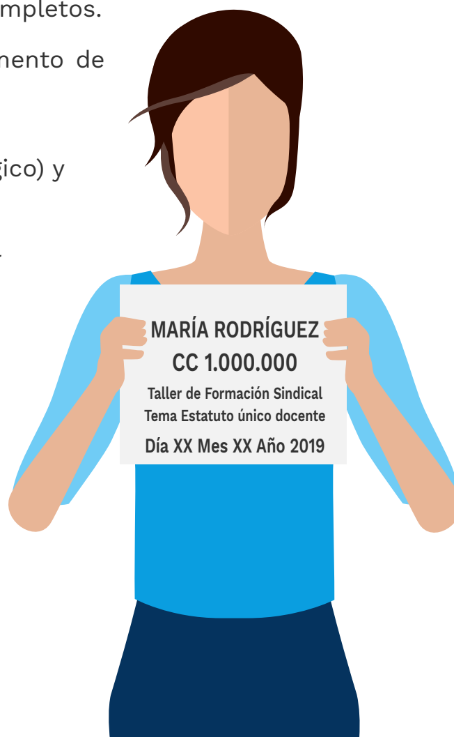
Ilustración 3. Ejemplo de la hoja de identificación