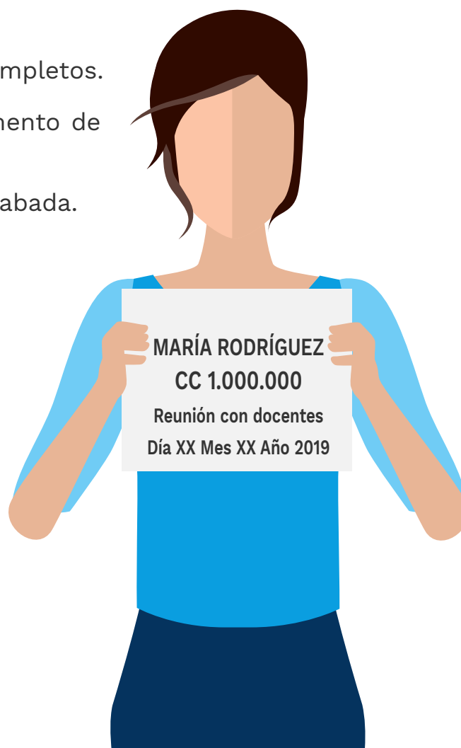
Ilustración 3. Ejemplo de la hoja de identificación