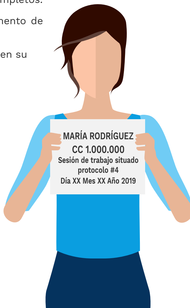
Ilustración 3. Ejemplo de la hoja de identificación