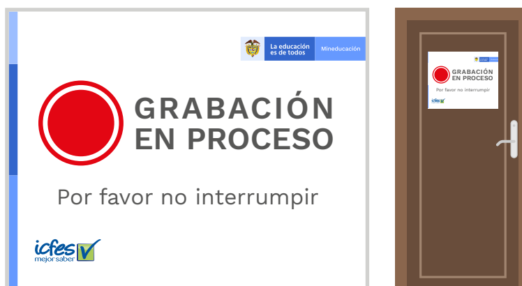
Ilustración 1. Ejemplo de aviso de grabación en proceso