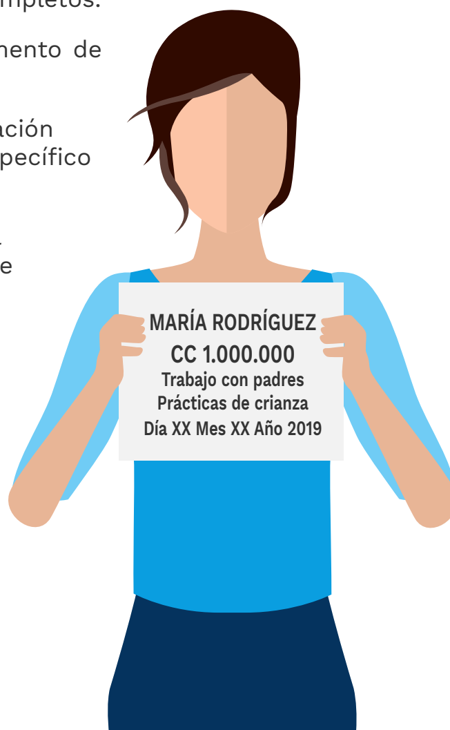
Ilustración 3. Ejemplo de la hoja de identificación