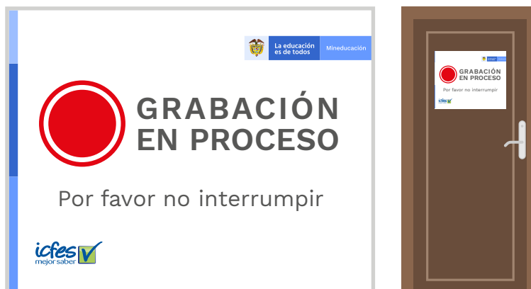
Ilustración 1. Ejemplo de aviso de grabación en proceso