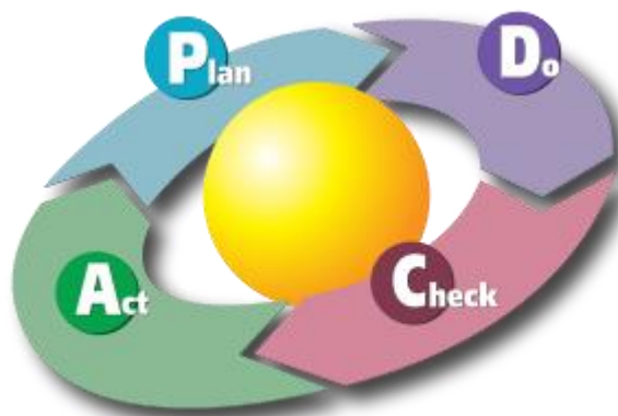
Figura 2. Creación de valor público

Así mismo, la gestión estratégica se estructura bajo el ciclo de planear, hacer, verificar y actuar. Dentro de este ciclo se deben tener en cuenta variables específicas como: qué, cómo y para qué se planeó; con qué recursos se ejecutará lo planeado; cómo se va a controlar lo ejecutado; con qué indicadores se medirán los resultados; qué acciones correctivas se tuvieron que tomar, entre otros.