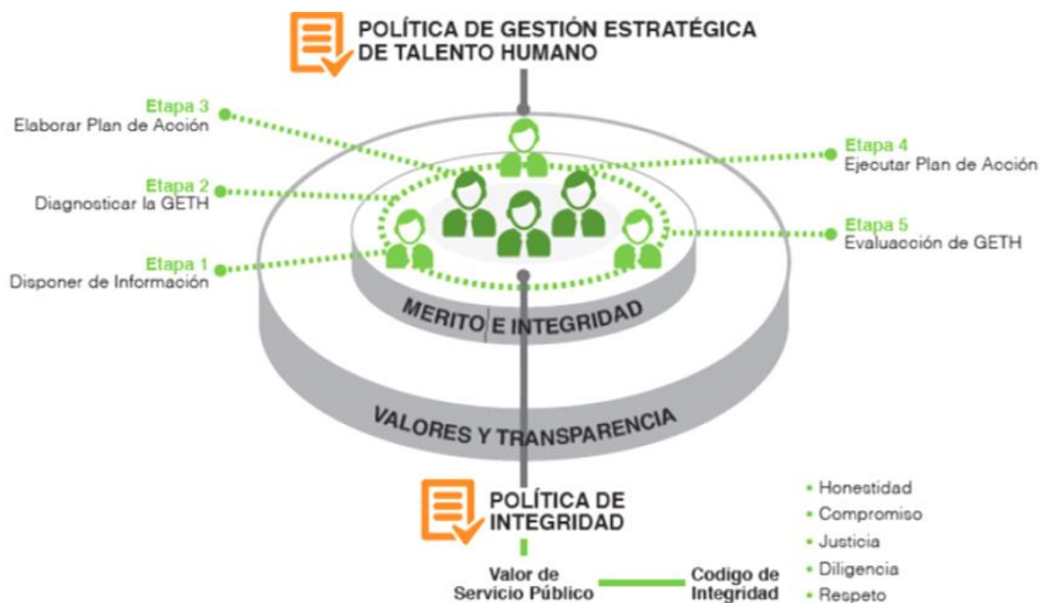
Figura 3. Dimensión Talento Humano MIPG

necesidades y problemas de los ciudadanos, esto explica que el tema de talento humano ocupe el centro del MIPG.