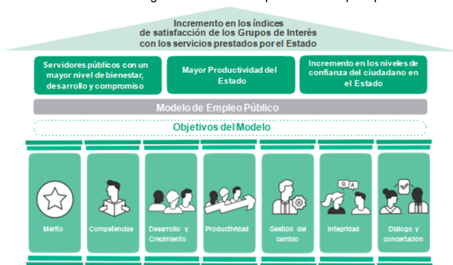
Figura 4. Marco de la política de empleo público