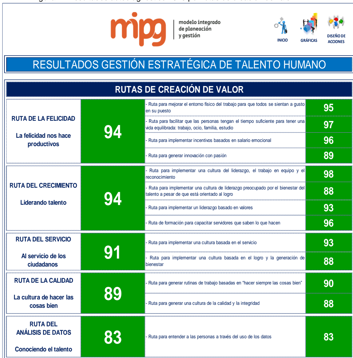
Figura 2. Resultados autodiagnóstico 2019 por rutas de creación de valor