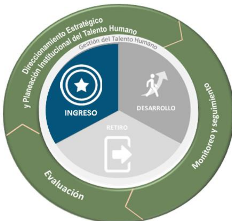
Figura 5. Modelo de empleo público

Para cumplir con estos objetivos se plantea un modelo de empleo público en el que, con base en un direccionamiento estratégico macro, se identifican cuatro subcomponentes del proceso de gestión estratégica del talento humano: Direccionamiento estratégico y planeación institucional, ingreso, desarrollo y retiro.