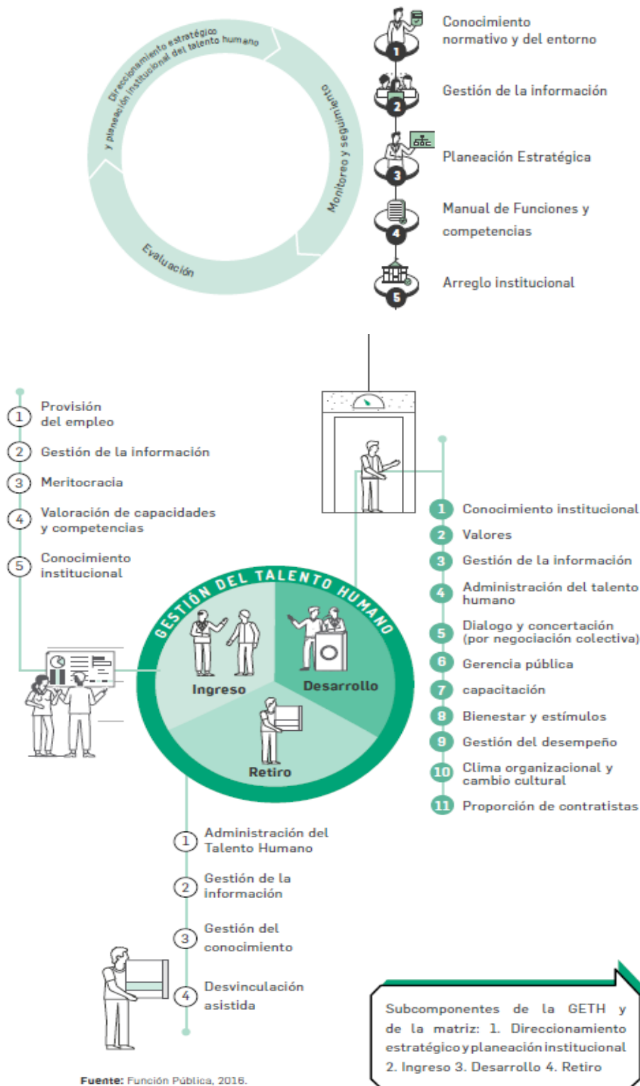
Figura 6. Subcomponentes y categorías de la política de GETH

Para lograr esta articulación es importante que desde la fase de planeación estratégica se puedan identificar las necesidades de mejora y uno de los