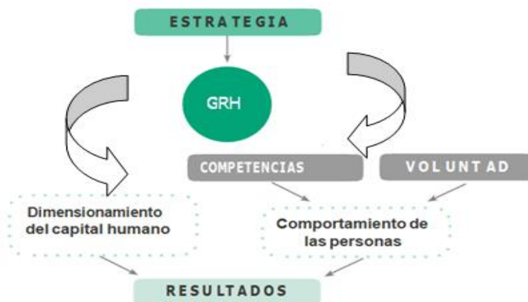
Figura 1. Creación de valor público