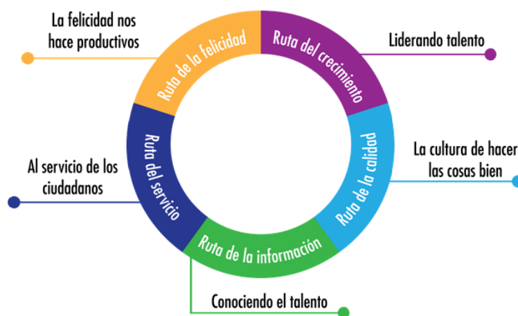
Figura 7. Rutas de creación de valor

Dentro del proceso de cierre de brechas la GETH se puede realizar intervención desde una perspectiva orientada directamente a la creación de valor público, con base en algunas agrupaciones de factores que impactan directamente en la efectividad de la gestión a través de las “Rutas de creación de valor”, estas trabajadas en conjunto, permiten impactar en aspectos puntuales y producir resultados eficaces para la GETH.