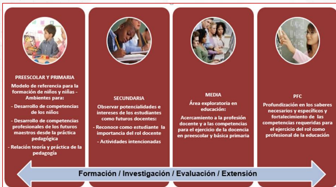
Figura 1. Articulación de los niveles educativos con los ejes de Formación, Investigación, Evaluación y Extensión en la trayectoria educativa de la ENS