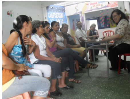
Foto: Grupo focal habitantes zona de frontera colombo – venezolana

Cabe destacar que dentro de los grupos focales que se aplicaron se encuentran Comunidades étnicas (Población Afrodescendiente), Adultos iletrados, Menores con necesidades educativas especiales y limitaciones, Afectados por la violencia (desplazados), Menores en riesgo social (Niños y Niñas adolescente en Protección), Habitantes de frontera, Población rural dispersa, todos ellos catalogados como población vulnerable por el Ministerio de Educación Nacional (MEN).