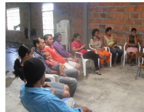
Foto: Grupo Focal habitantes desplazados por la violencia