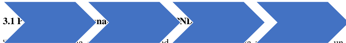
Ilustración 2. Políticas públicas educativas y planes bajo las cuales se fundamenta el plan territorial de formación docente de la entidad territorial certificada Risaralda

“El camino hacia la calidad y la equidad es una hoja de ruta para avanzar hacia un sistema educativo de calidad que promueva el desarrollo económico y social del país, y la construcción de una sociedad cuyos cimientos sean la justicia, la equidad, el respeto y el reconocimiento de las diferencias”