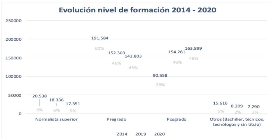
Ilustración 1. Evolución del nivel de formación 2014 – 2020