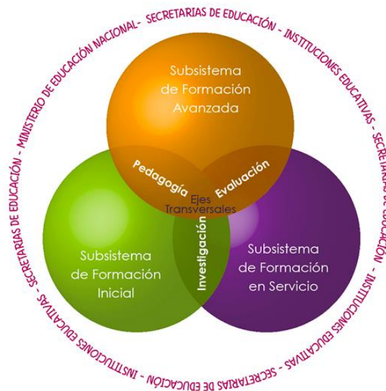
Ilustración 4. Gráfica que ilustra el Sistema Colombiano de Formación de Educadores

El Ministerio de Educación Nacional, mediante construcción colectiva definió el Sistema Colombiano de Formación de Educadores y Lineamientos de Política , allí se define el marco de referencia que orienta la formación de los docentes en el territorio nacional, así mismo se definen los subsistemas de formación y ejes transversales que articulan el sistema. Ver grafica que ilustra el sistema.