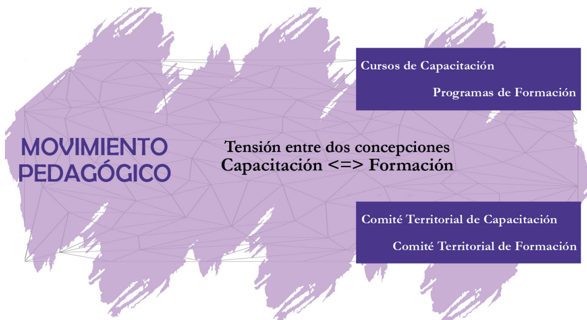
Diagrama 2: Primer hito en la formación docente

Esta tensión entre capacitación y formación y la transición que muestran las adecuaciones generadas a finales del siglo XX, evidencian una tarea compleja en la que aún es necesario persistir. Por ejemplo, a pesar de que ya existen consensos para hablar de Comités de Formación Docente, y no de Comités de Capacitación; de Planes Territoriales de Formación Docente y no de planes territoriales de capacitación, es vital seguir mostrando, en el ámbito de la política pública que, más allá de un asunto nominal, lo que hay allí es un tema de concepciones sobre la pedagogía y la valoración del saber pedagógico de los maestros en todo proceso de formación, cualquiera que sea su modalidad, como una acción pensada, intencionada, reflexiva y crítica, en contexto y generada desde comunidades de saber, distante de aquellas ancladas en la tradición instrumental y operativa vinculada a la ejecución (Diagrama 3).