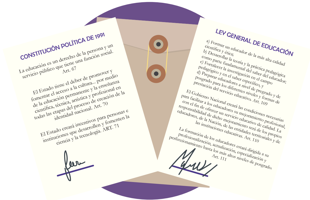
Diagrama 1: Política pública sobre formación docente como un precepto constitucional

Si bien este marco normativo es importante, lo es también la dinámica generada a partir de la década de los 80 por parte de grupos de reflexión liderados por maestros desde las escuelas y en los territorios, por el gremio de educadores y grupos académicos vinculados a universidades y centros de investigación que confluyeron en una movilización nacional, conocida como Movimiento Pedagógico. Para los años 90, las discusiones abiertas en torno al sentido transformador de la educación y las escuelas, unidas a la proliferación de posturas y visiones que promovieron cambios en las concepciones y las regulaciones del sector, configuraron un escenario para redimensionar la importancia de la formación docente. En consecuencia, se promovieron programas de formación inicial y de posgrado, así como programas de formación continua o permanente para los docentes en ejercicio. Para el primer caso, este proceso se concretó con la creación del Consejo Nacional de Acreditación - CNA y la promulgación del Decreto 272 de 1998. En el segundo caso, la irrupción del Decreto 709 de 1996, fue determinante.