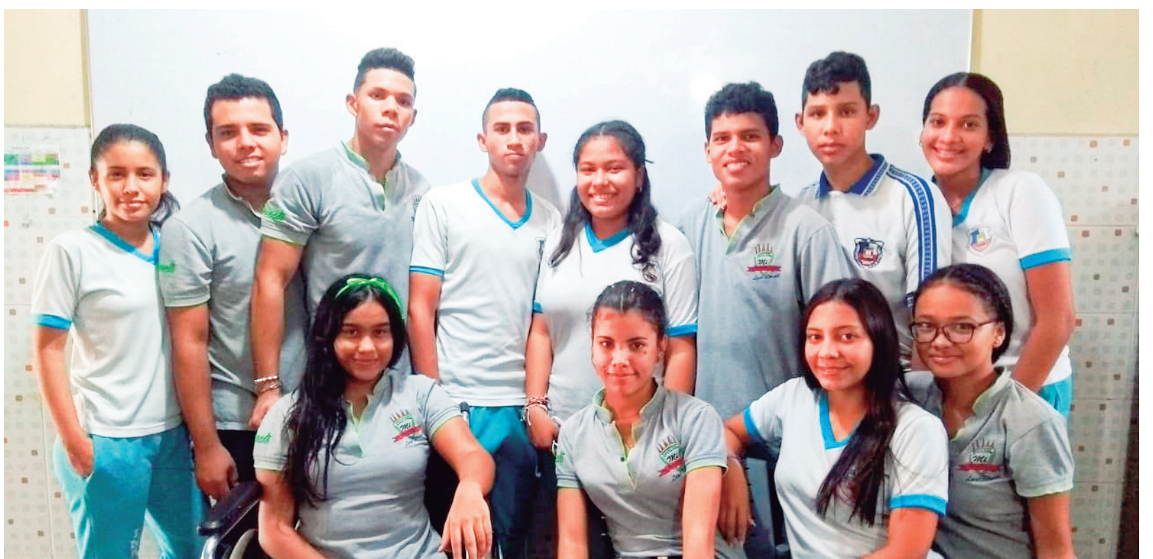
Bachilleres de la Institución Educativa Santa Rosa de Lima con titulación en Programación del SENA.

Bajo el programa de doble titulación hoy se ofrecen 126 programas de formación técnica relacionados con los sectores de servicios, agropecuario, industria, electricidad, salud, comercio, hotelería y turismo, textiles y construcción, teniendo el mayor porcentaje de programas ofertados en los sectores de servicios con 24%, seguido de la industria con 23.8% y el agropecuario con 16.7 %.