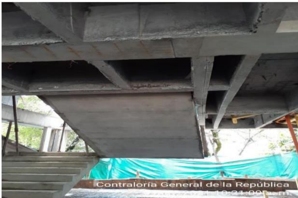
Fotografía No. 2 - I.E. ENIQUE VELEZ – Losa 2do piso

No se están cumpliendo los espesores mínimos requeridos, además se pueden concluir graves falencias en el proceso constructivo de la losa, como la no utilización de paneles para darle una separación al refuerzo desde la formaleta, sin proporcionarles recubrimiento y evitando lo que se observa en las imágenes que es una exposición de la malla y los aceros de refuerzo. Aun sí se resanan, no cumplirían con los espesores requeridos, llevando a la losa a una pérdida acelerada de las propiedades del acero por procesos de corrosión y oxidación ya que la estructura está en contacto directo con sus principales agentes degradadores como lo son el oxígeno, la humedad y el CO 2 .