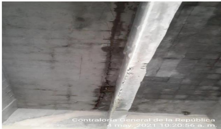
Fotografía No. 1 - I.E. ENRIQUE VELEZ – Losa 2do piso