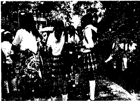
Imagen No. 1 Consumo Complemento Alimento I.E. Técnico Santander

Los centros educativos ubicados en la zona urbana del municipio no cuentan con infraestructura para el almacenamiento, preparación, distribución y consumo de los complementos alimentarios; el operador prepara las raciones alimentarias en una cocina satélite y las distribuye por cada establecimiento educativo: