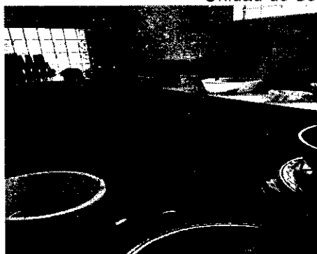
Imagen No. 8 y 9 Unidad de Servicio I.E. Municipio Bolívar

Este municipio tiene problemas de abastecimiento de agua potable, se debe hacer almacenamiento para la preparación de alimentos pero su manejo y cuidado no es el más adecuado debido a que se recolecta en diferentes recipientes, sin tapa y se ubican en el piso donde hay circularización del personal de la unidad, lo que representa posibles riesgos de contaminación. Estas unidades desconocen el Programa de Abastecimiento de Agua al que está obligado el operador adelantar en la etapa de alistamiento con el fin de iniciar las acciones respectivas para el monitoreo de la calidad de agua para el consumo de los estudiantes.