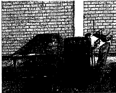
Imagen No. 5 Consumo Complemento Alimento I.E. José María Córdoba