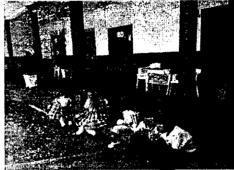
Imagen No. 2 Consumo Complemento Alimento I.E. Ana Josefa Morales