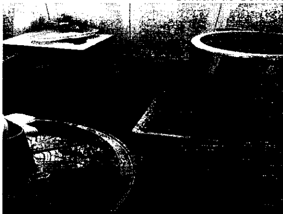
Imagen No. 10 a 14 Unidad de Servicio I.E. Municipio Bolívar

Otra situación que se evidenció fue el uso y ubicación indebida de la pipa de gas (combustible) y el estado y mantenimiento de las estufas que se utilizan para la preparación de alimentos, evidenciándose un posible riesgo en la seguridad tanto del personal manipulador como de los estudiantes beneficiados y atendidos en cada unidad de servicios, situación que se encontró en los municipios de Patía y Bolívar.