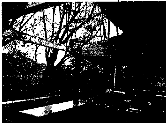
Imagen No. 8 Unidad de Servicio I.E. Municipio El Bordo

Esta unidad de servicio se encuentra sin techo desde hace más de 8 meses.