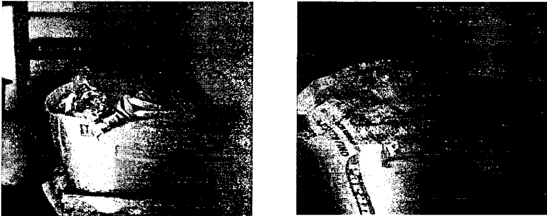
Imagen No. 6 Bodega Almacenamiento Víveres I.E. El Rosario

La IE El Rosario no cuenta con infraestructura adecuada para el almacenamiento de víveres, ausencia de estantes y estibas, identificándose productos sobre el piso, expuestos al riesgo de contaminación por contacto con roedores e insectos: