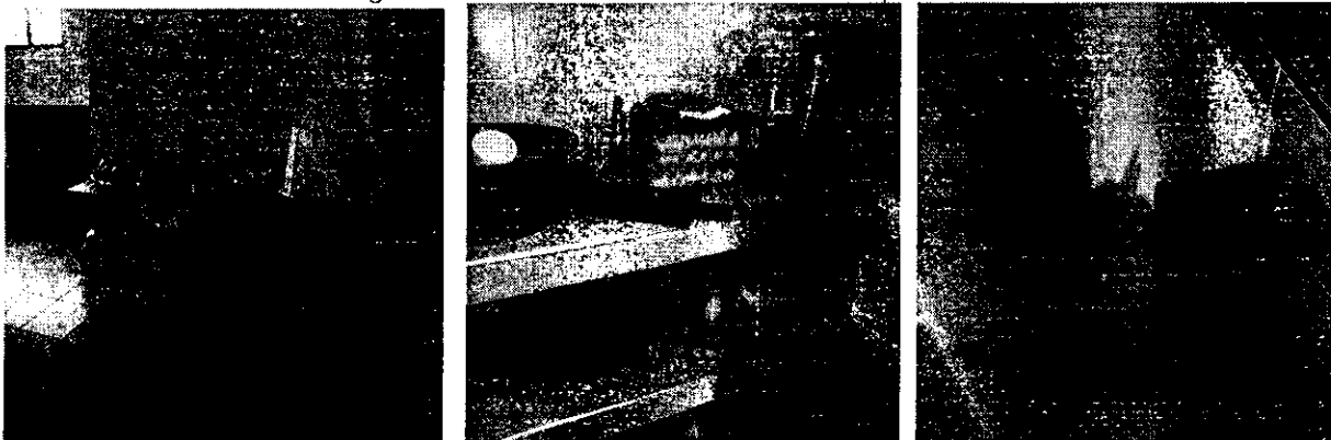
Imagen No. 7 Bodega Almacenamiento Víveres I.E. Municipio El Bordo

El almacenamiento de los productos no es el adecuado, se encontraron en el piso, cerca de detergentes, en cajas de cartón y sin medidas de seguridad contra plagas.