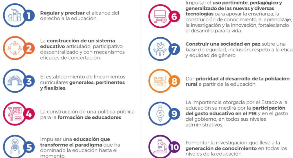
Ilustración 4. Desafíos Plan Nacional Decenal de Educación 2016-2026