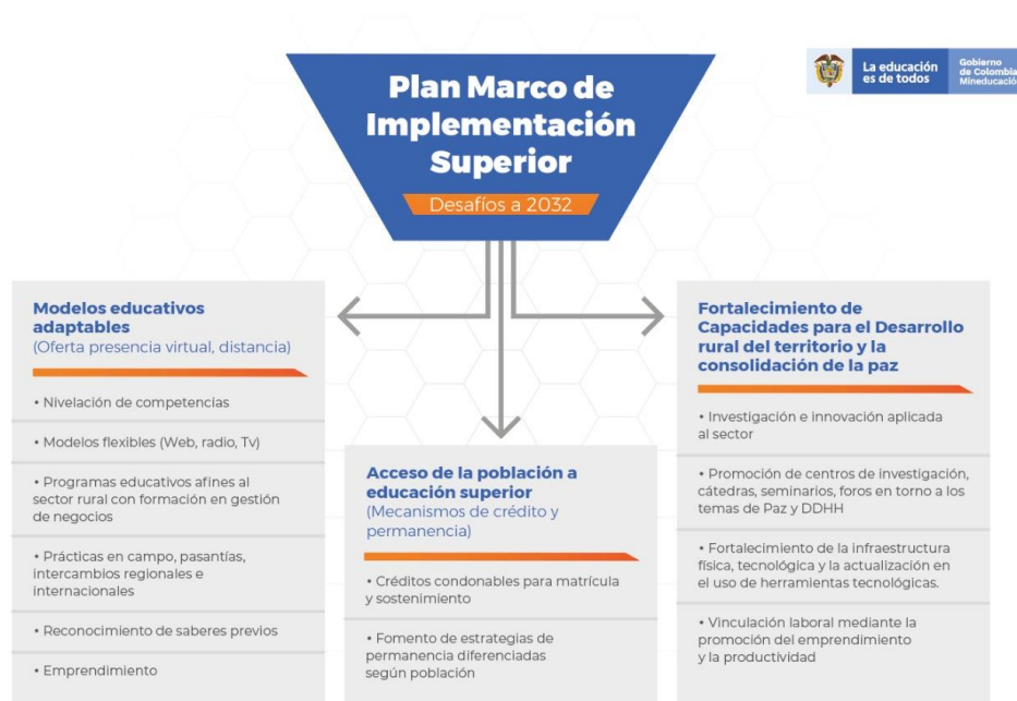
Ilustración 2 Desafíos del Plan Marco de Implementación para educación superior MEN. (2018). Elaborado a partir de los desafíos del PMI.