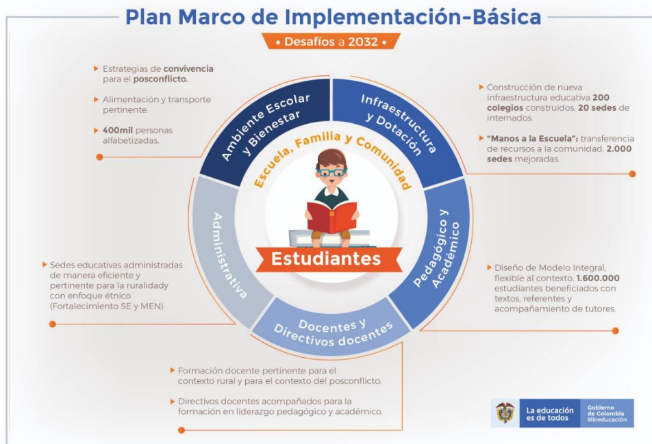
Ilustración 1 Desafíos del Plan Marco de Implementación para educación preescolar, básica y media. MEN. (2018). Elaborado a partir de los desafíos del PMI.