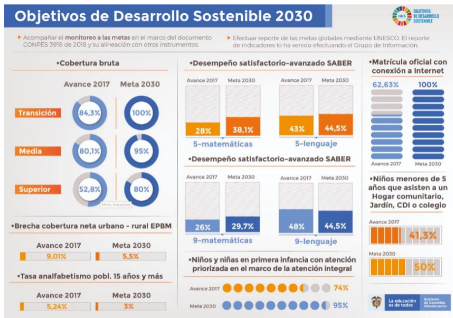
Ilustración 3 Objetivos de Desarrollo Sostenible con impacto en el sector educación MEN. (2018).