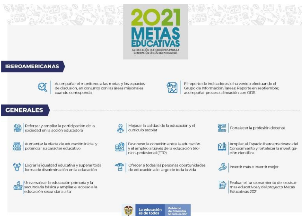
Ilustración 6. Metas Iberoamericanas 2021 MEN. (2018).

La siguiente ilustración resume las metas propuestas: