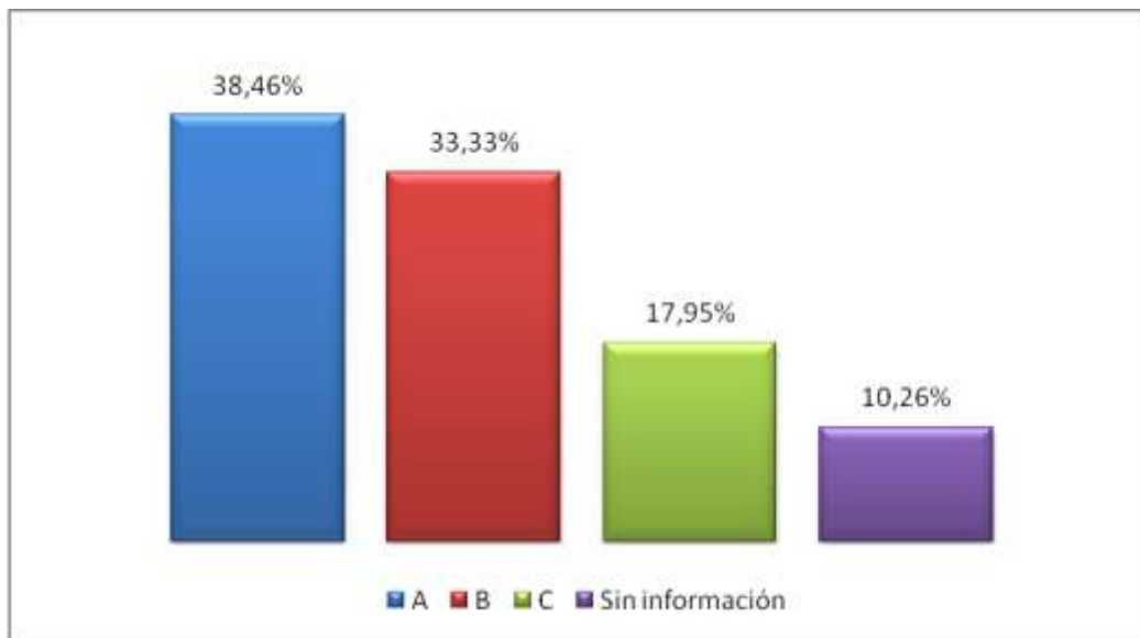
Grafica 2 Porcentaje de IES por tipo de calificación