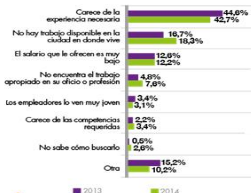
Gráfica 1. Tiempo transcurrido para obtener el primer empleo y tipo de vinculación que tienen los recién graduados de instituciones de educación superior 2013 - 2014