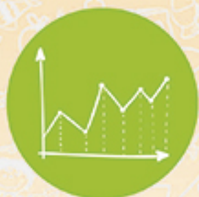
Plan de inversión Mensualizado del Anticipo