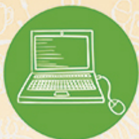
Informe de inversión y buen manejo del anticipo con soportes