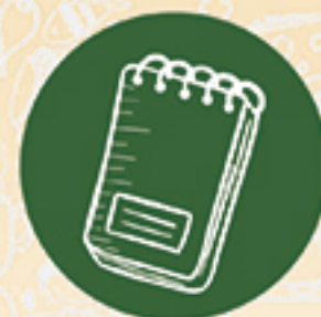
Soportes de gastos