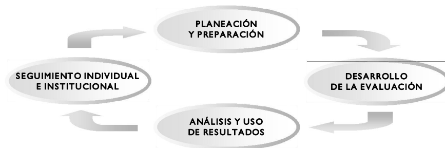
FIGURA 1. ETAPAS DEL PROCESO DE EVALUACIÓN DE DESEMPEÑO DE DOCENTES Y DIRECTIVOS DOCENTES

ren la obtención de información objetiva, válida y confiable, para ponderar el grado de cumplimiento de las funciones y responsabilidades inherentes al cargo que el docente o directivo docente desempeña y del logro de resultados, a través de su gestión. En la Figura 1 se esquematizan las etapas del proceso de evaluación.