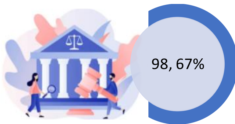
Imagen 3 Tasa de éxito del trimestre

Es importante mencionar que la tasa de éxito del segundo trimestre del 2021 fue en promedio del 98,67%, es decir, que tan solo 1 caso ha sido desfavorable para la entidad con una pretensión relacionada con homologación y nivelación salarial .